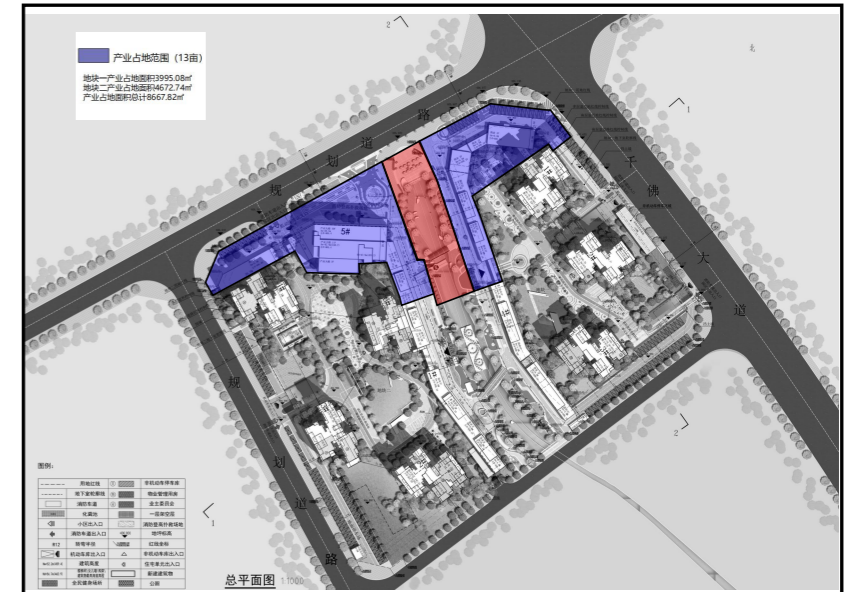
产业占地范围示意图