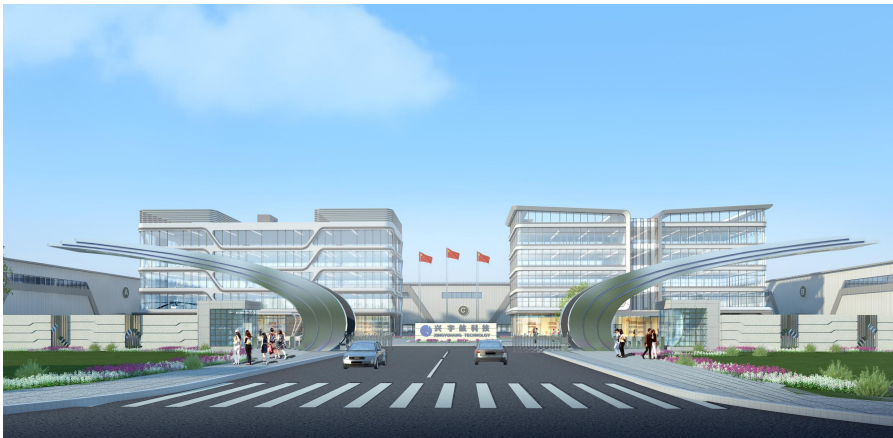
厂区主入口效果图