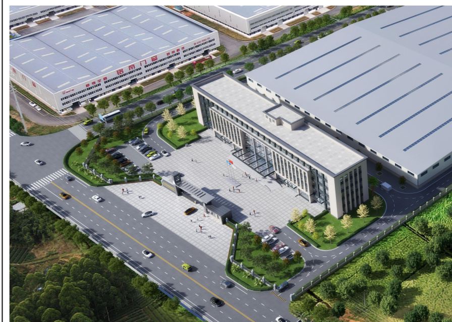
技术生产楼局部鸟瞰图